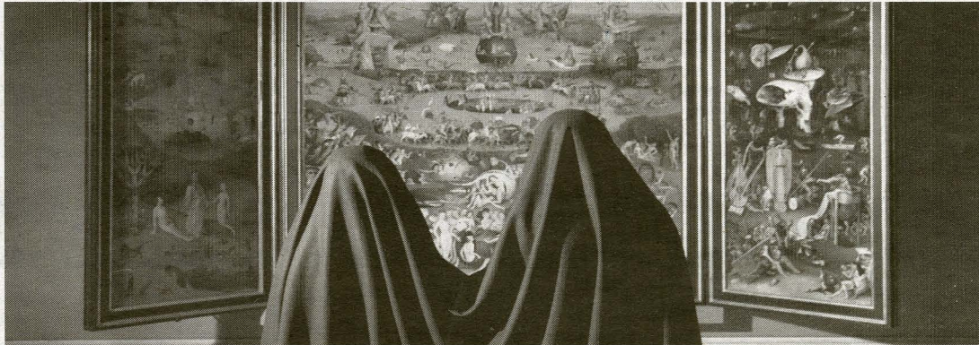
Adad Hannah, image tirée du vidéo Earthly Delights (2008).

Deux personnes, de dos, couvertes d'un seul drap noir (ce qui leur confère une forme générale évoquant un chameau!) se tiennent immobiles durant plusieurs minutes devant un célèbre