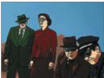
Arriba, Going nowhere fast , de J. Tobias Anderson; a la derecha, Meet my meat NY , de María Cañas.

Aunque es difícil identificar una tendencia predominante, se perfila un común denominador en la voluntad de distanciarse de los parámetros estilísticos y el ritmo frenético de la producción