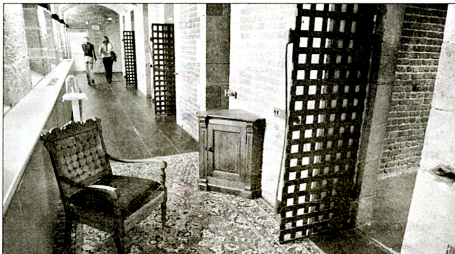
Partout, dans les sept salles consacrées aux collections permanentes du MNBAQ, nous attendent des surprises qui mettent en évidence des œuvres récentes, au milieu de chefs-d'œuvre anciens. — PHOTOS LE SOLEIL, PATRICE LAROCHE

Parvenu à la salle Riopelle, «tapisée» du polyptique Hommage à Rosa Luxembourg , le visiteur est invité à pénétrer dans La volière (2004) de Yannick Pouliot, un pavillon en fer forgé au style suranné. À peine entré, le regard-écouteur déclenche un enregistrement de chants d'oiseaux pourtant absents, cependant qu'à travers les grilles, il redécouvre avec un regard neuf les oies fantomatiques de la murale riopel-